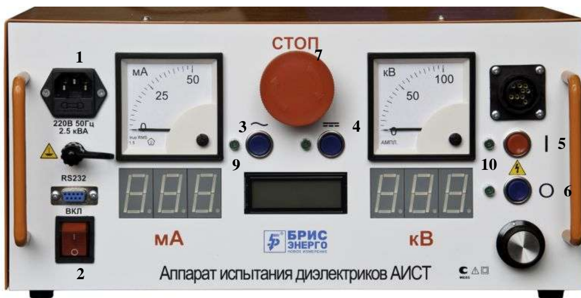
Рисунок 2 Пульт управления