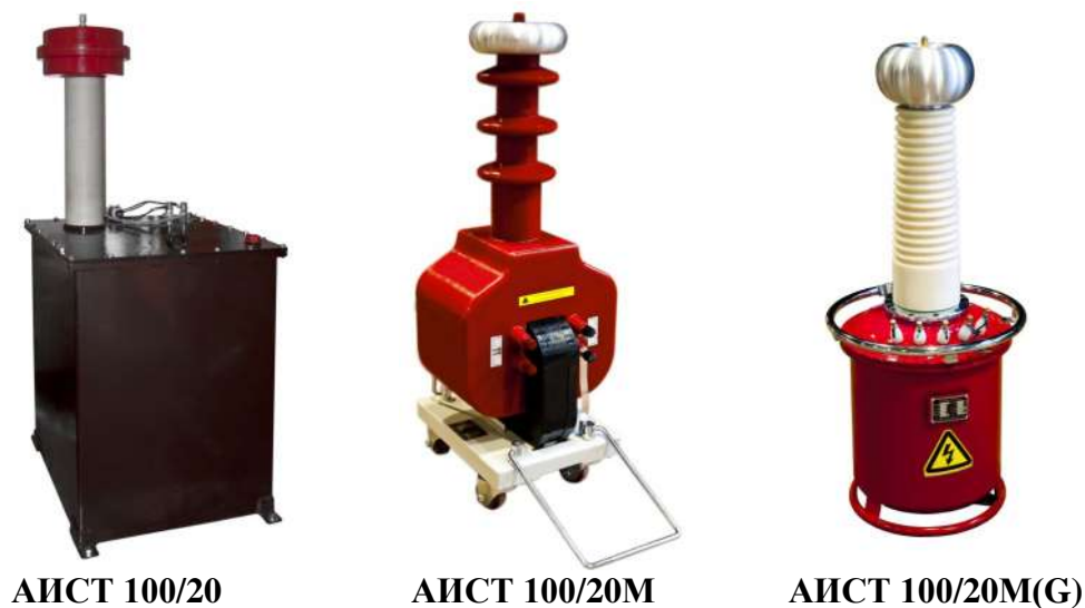
Рисунок 1 Общий вид модификаций

1.5.1 Общий вид аппарата представлен на рисунке 1. Аппарат состоит из высоковольтного трансформатора, пульта управления (ПУ), присоединительных кабелей и тележки для перевозки.