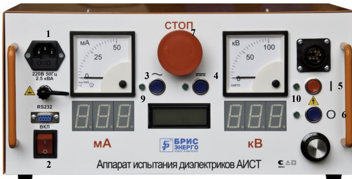
Рисунок 2 Пульт управления