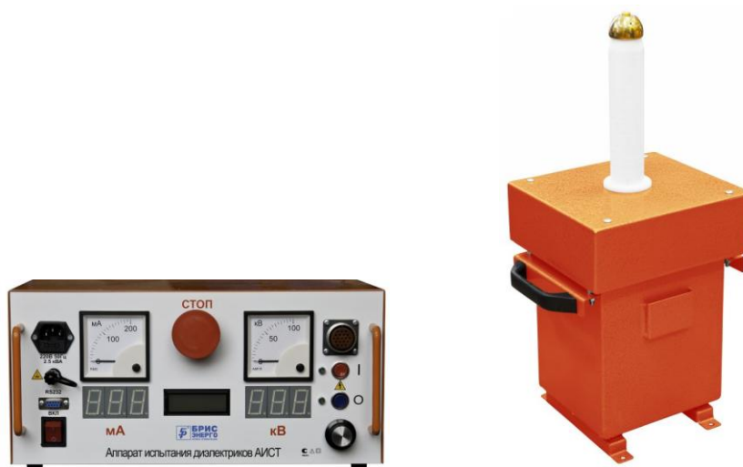
Рис.1.Высоковольтный блок и блок управления.

1.5.1 Общий вид аппарата представлен на рисунке 1. Аппарат выполнен в виде двух переносных блоков, соединенных кабелем: высоковольтного блока (ВВБ) и пульта управления (ПУ).