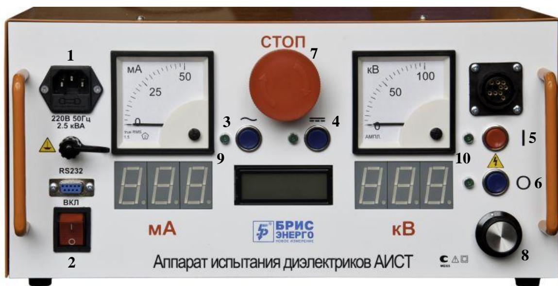
Рисунок 2 Пульт управления

1.5.2 Общий вид лицевой панели управления представлен на рисунке 2.